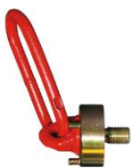
Manutention par 2 anneaux de levage repris sur les douilles M12