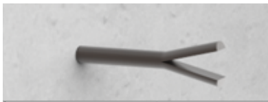
Possibilité d'intégrer d'autres douilles M12 pour tige de scellement