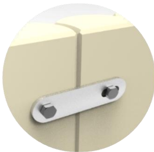
Fixation arrière avec reprise sur douilles M12