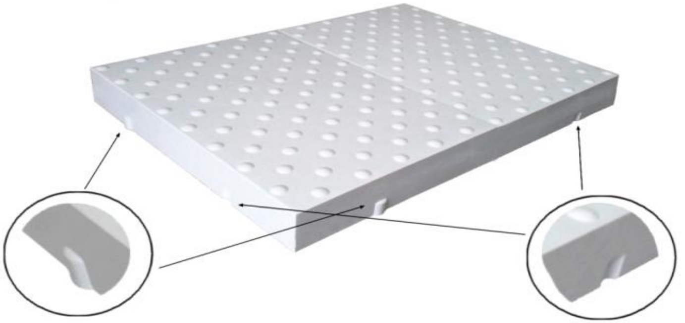
Alignement des plots